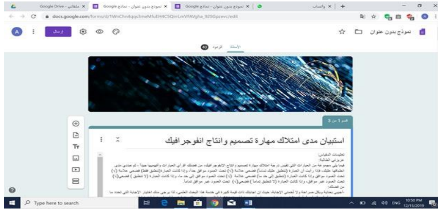
صورة من مقياس الإنفوجرافيك بعد تحويله للصيغة الإلكترونية (الشكل 2)