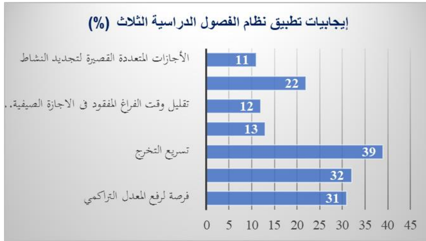
شكل (٣): التمثيل البياني للنسب المئوية لآراء الطالّبات حول إيجابيات تطبيق نظام الفصول الدراسية الثلاث.

وفيما يتعلق بآراء الطالّبات حول سلبيات نظام الفصول الدراسية الثلاث، كانت النسبة الأعلى (٣٨%) من الخيارات بأن من أكثر سلبيات النظام، "الإرهاق الذهني والضغط النفسي" بينما الاختيار "ضيق الفترة الدراسية للفصل الواحد" كان بنسبة ٣٣% و"تقليص فترة الإجازة الصيفية" بنسبة ٢٨%، كذلك فإن "قرب مواعيد الاختبارات النهائية للمقررات من بعضها البعض" كانت أحد السلبيات من وجهة نظر الطالّبات بنسبة (٢٤%). بينما حظت الخيارات "عدم وجود مدة زمنية كافية لشرح المقرر كاملاً" و"عدم الاستفادة من التطبيقات العملية" النسب الأقل (١٦ & ١٣%) على التوالي. توضح الأشكال (٣)، (٤) النسب المئوية لآراء الطالّبات حول إيجابيات وسلبيات نظام الفصول الثلاثة.