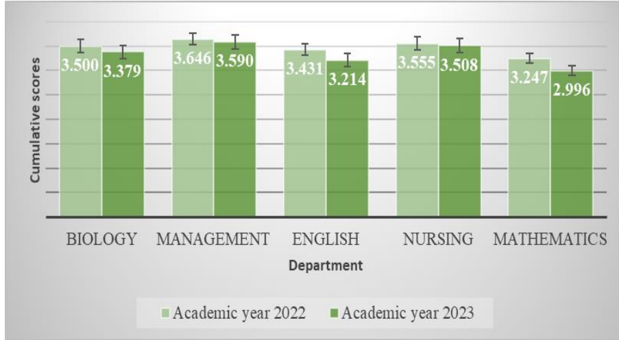
شكل رقم (١): التمثيل البياني للمعدلات التراكمية لطالبات الأقسام الأكاديمية بالكلية خلال العامين الدراسيين ٢٠٢٢ و ٢٠٢٣.