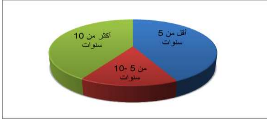
الشكل الرقم (٢): توزيع أفراد عينة الدراسة وفقاً لمتغير عدد سنوات الخدمة

يتبين من الجدول رقم (٢)، والشكل رقم (٢) أن الإداريات محل الدراسة اللاتي سنوات خدمتهن أقل من ٥ سنوات بنسبة (٤٢.٧%) وهن غالبية أفراد عينة الدراسة، ثم اللاتي سنوات خدمتهن أكثر من ١٠ سنوات بنسبة (٤١.٣%)، وأخيراً اللاتي سنوات خدمتهن من ٥ - ١٠ سنوات بنسبة (١٦%).